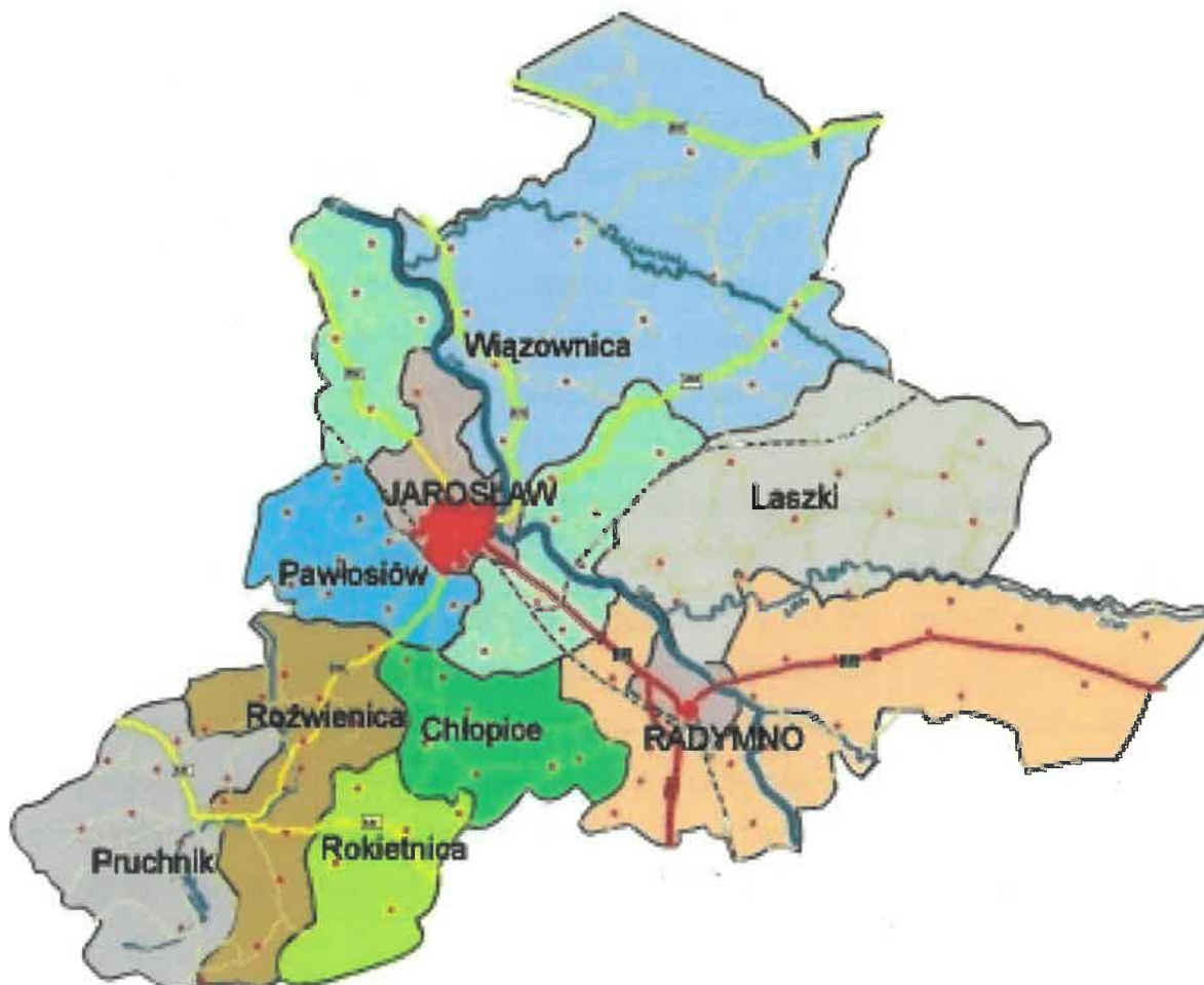
Mapa powiatu jarosławskiego w rozbiciu na gminy.